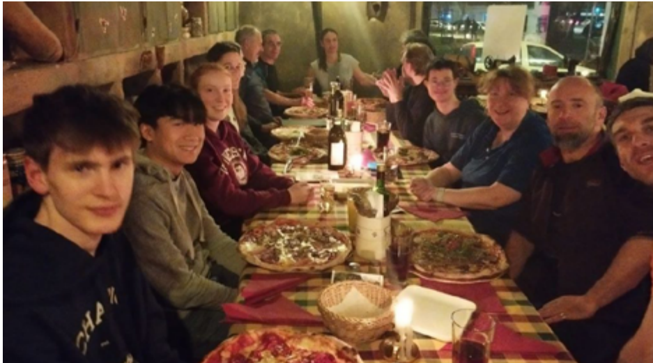
BT-LA/OL Team Nachbesprechung, am Freitag Abend nach dem Training und der Fortbildung